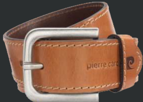
22 cognac / cognac