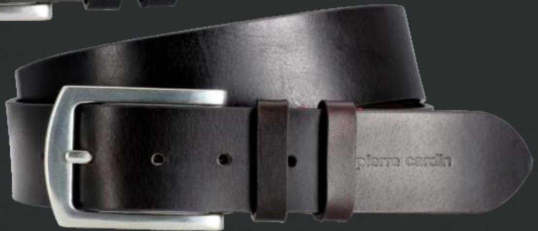
23 dunkelbraun / darkbrown