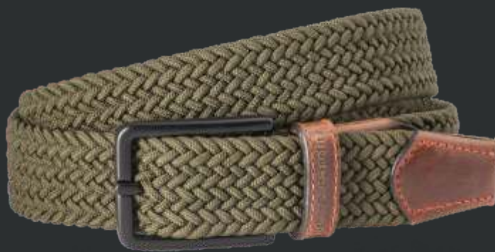
60 oliv / olive