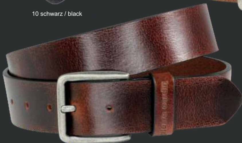
23 dunkelbraun / darkbrown