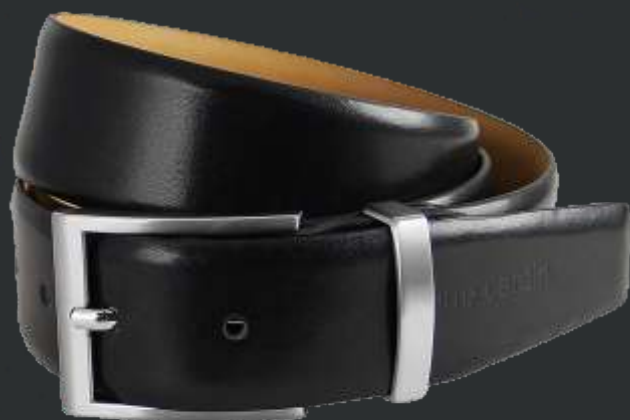
10 schwarz / black