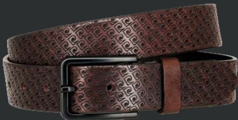
23 dunkelbraun / darkbrown