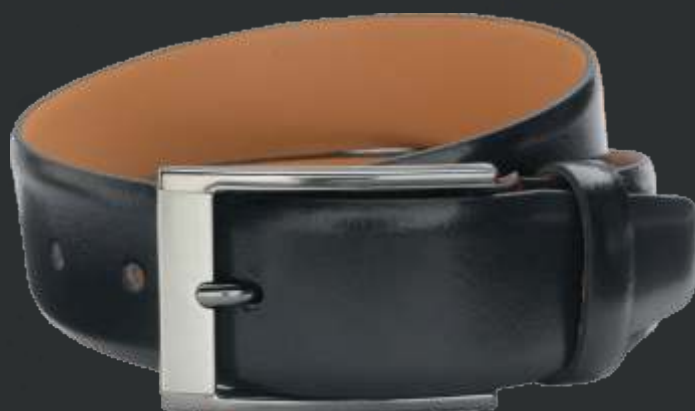
10 schwarz / black