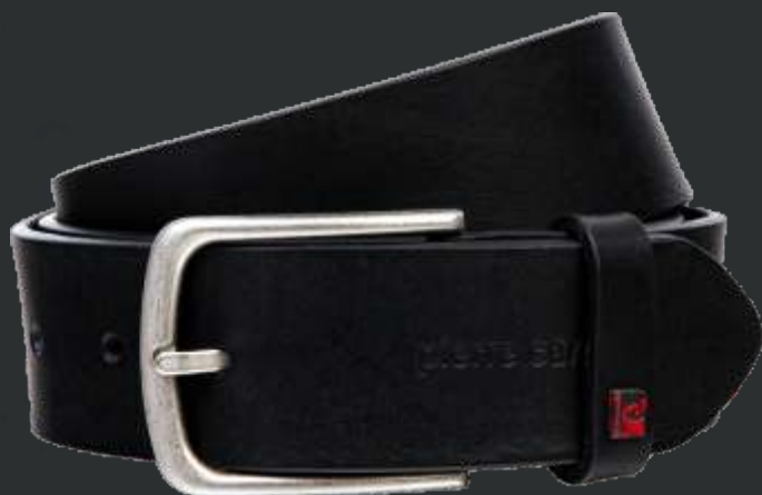
10 schwarz / black