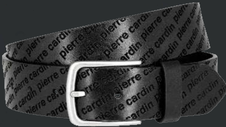
10 schwarz / black