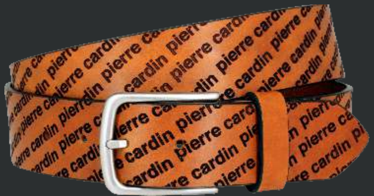
22 cognac / cognac