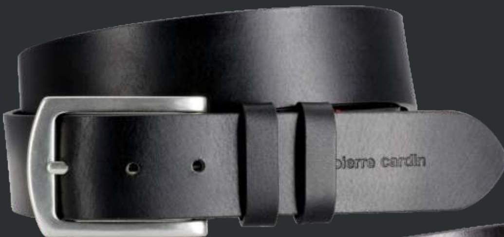
10 schwarz / black