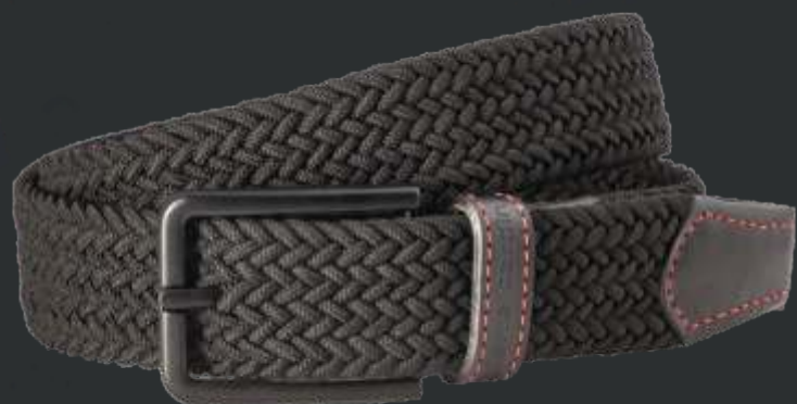
10 schwarz / black