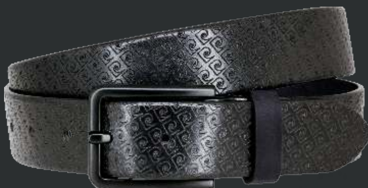
40 marine / navy