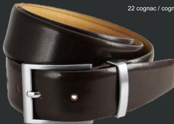
23 dunkelbraun / darkbrown