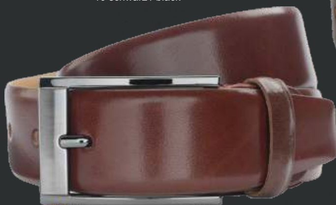
22 cognac / cognac