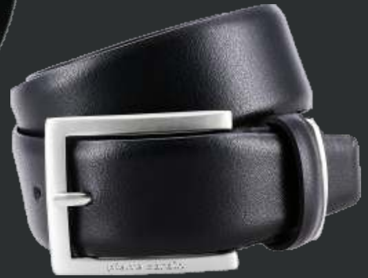
10 schwarz / black