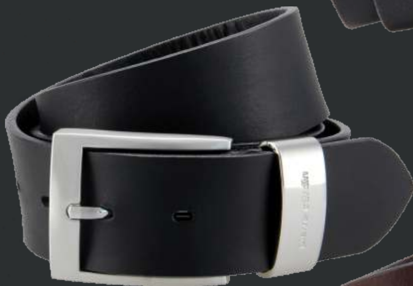
10 schwarz / black