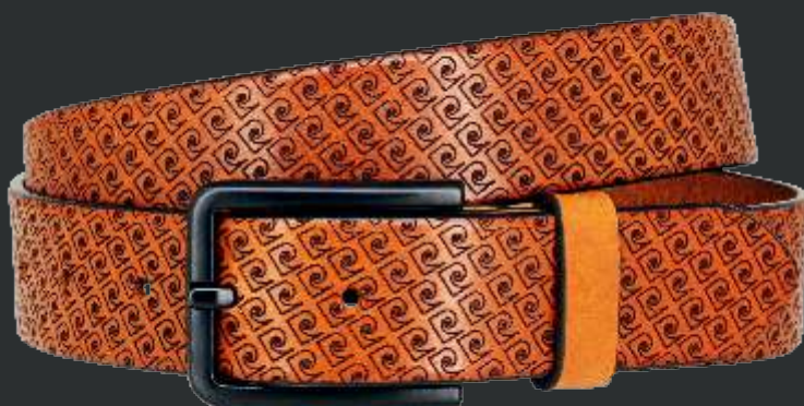
22 cognac / cognac