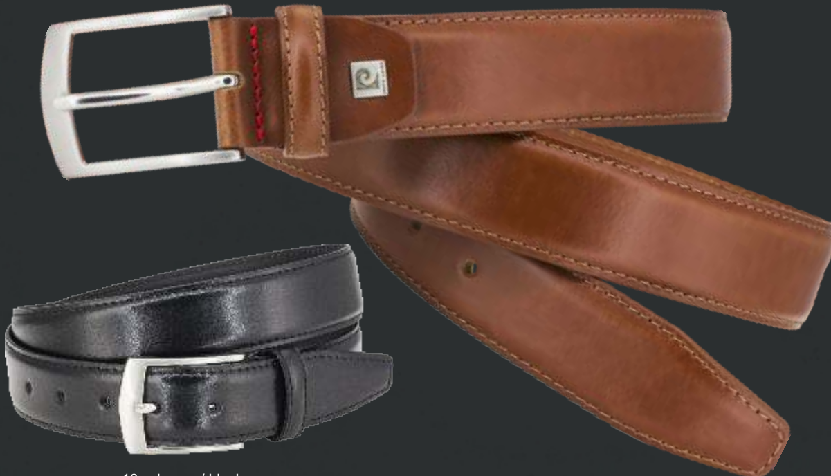
10 schwarz / black

Artikelnummer / article number: 1070080 Preiskategorie / price category: PC 11 Bundweiten / waists: 85 - 150 cm Breite / width: 35 mm