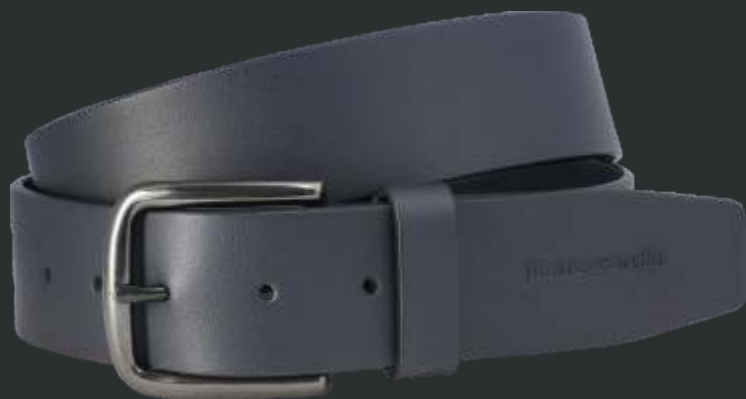
40 marine / navy