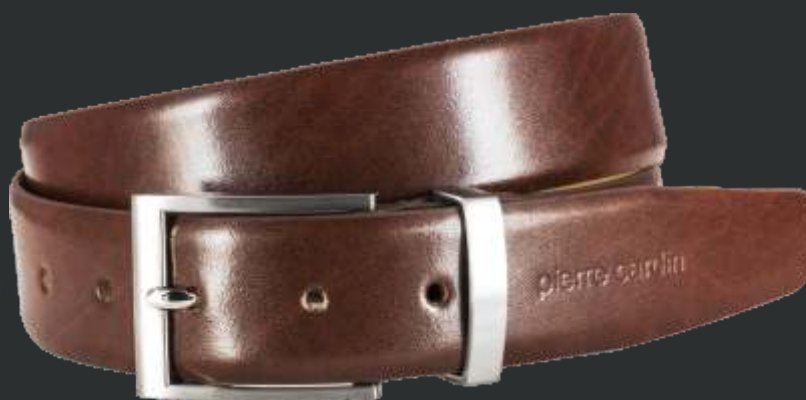
22 cognac / cognac