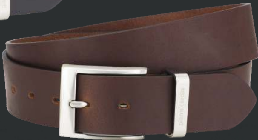
23 dunkelbraun / darkbrown