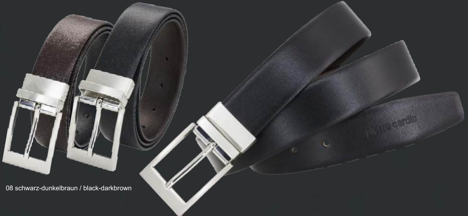
08 schwarz-dunkelbraun / black-darkbrown

Artikelnummer / article number: 1070081 Preiskategorie / price category: PC 13 Bundweiten / waists: 85 - 120 cm Breite / width: 32 mm