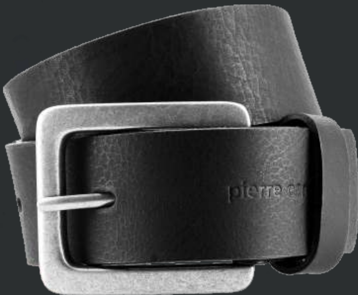
10 schwarz / black