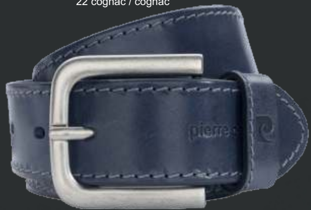
40 marine / navy