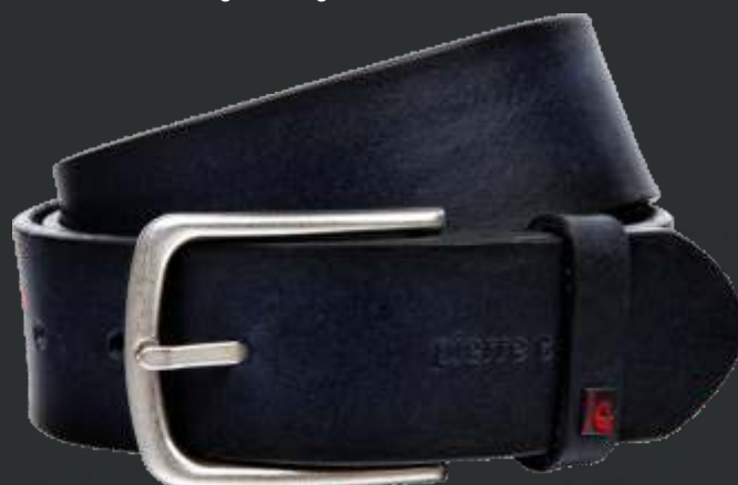
40 marine / navy