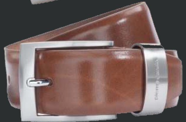
22 cognac / cognac