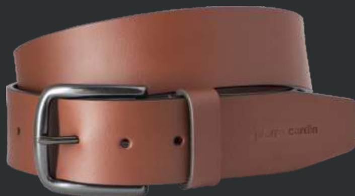
22 cognac / cognac