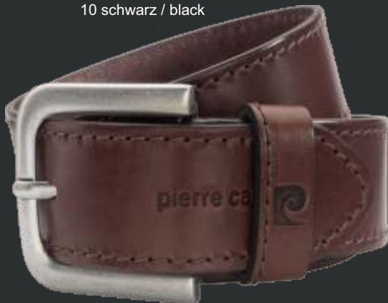
23 dunkelbraun / darkbrown