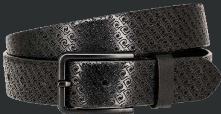
10 schwarz / black