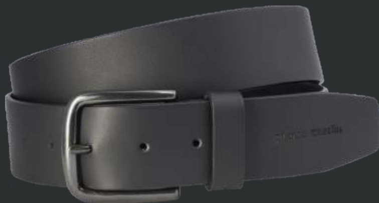
10 schwarz / black