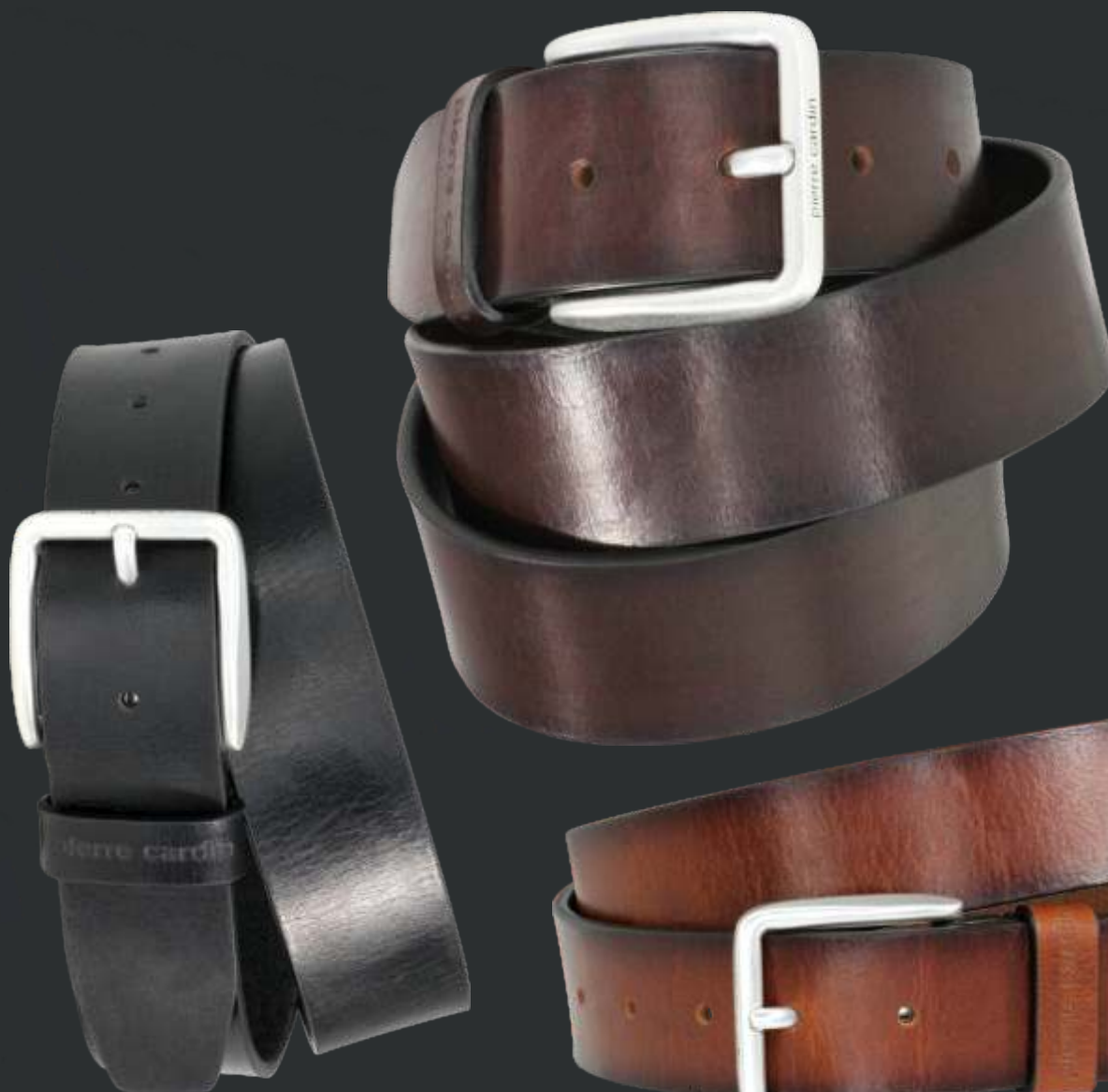
10 schwarz / black