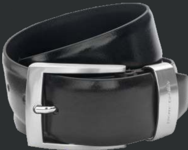
10 schwarz / black