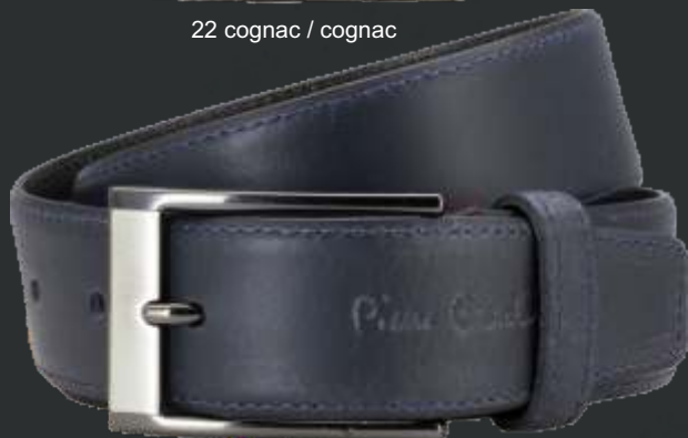
40 marine / navy