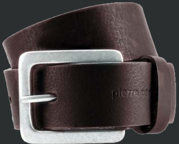
23 dunkelbraun / darkbrown