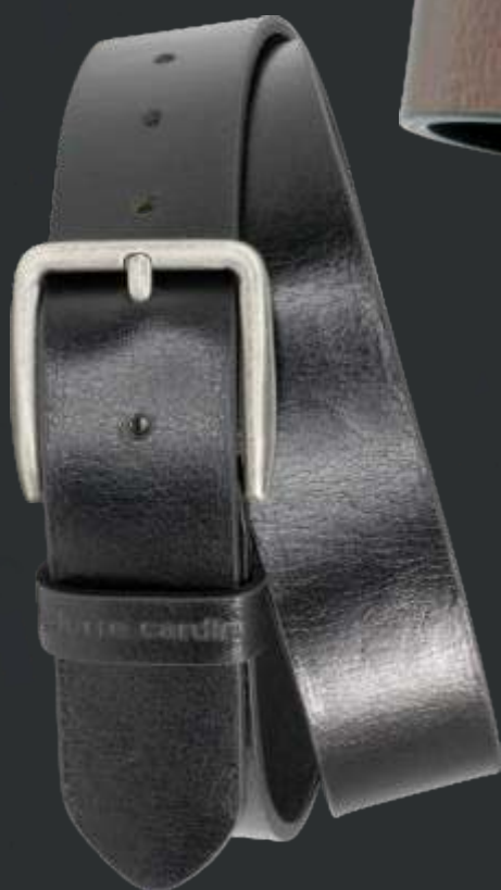
10 schwarz / black