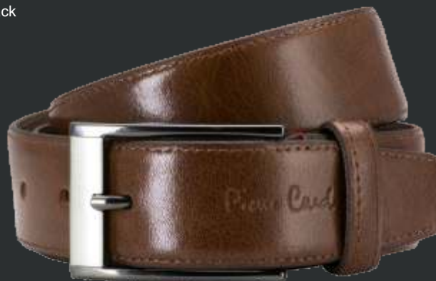
21 mogano / mogano