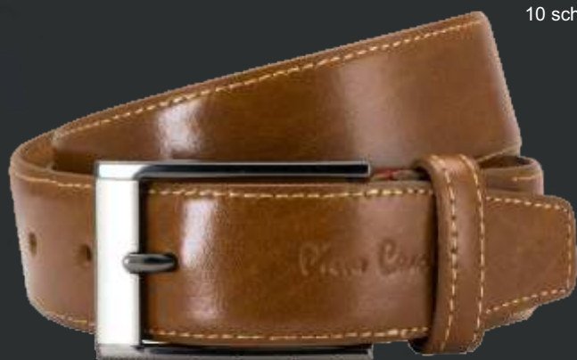
22 cognac / cognac