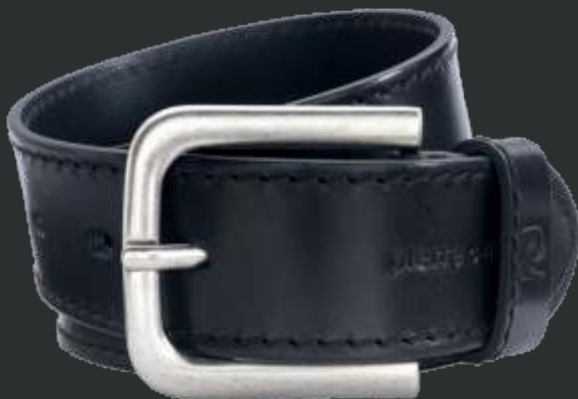
10 schwarz / black