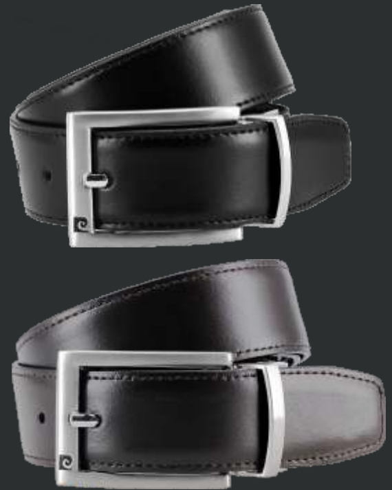
08 schwarz-dunkelbraun / black-darkbrown