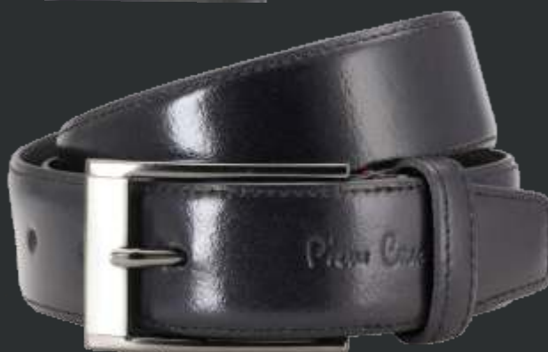
10 schwarz / black