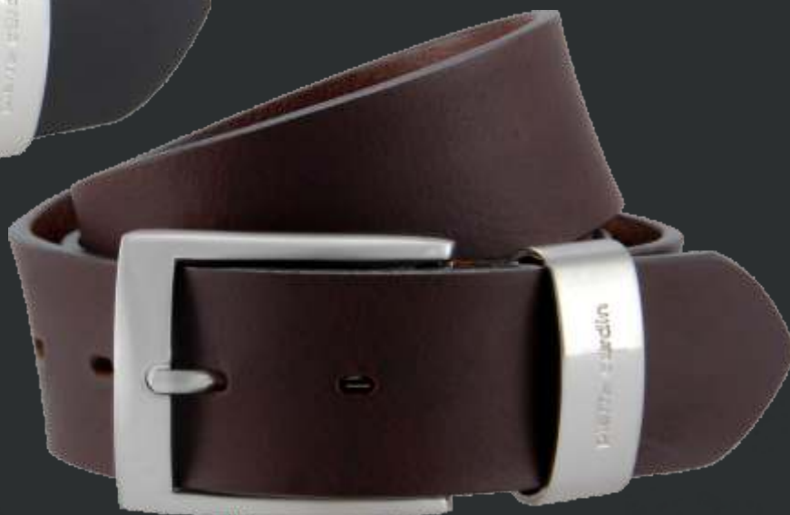
23 dunkelbraun / darkbrown