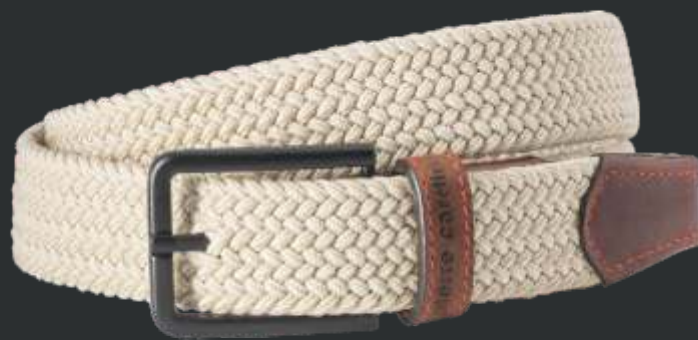
24 beige / beige