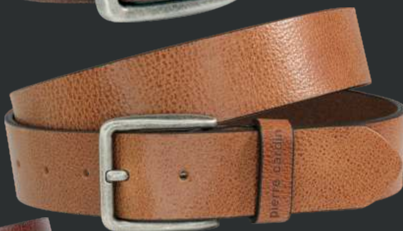
22 cognac / cognac