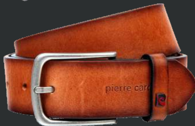
22 cognac / cognac