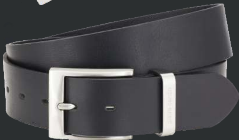
10 schwarz / black