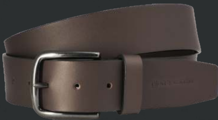
23 dunkelbraun / darkbrown