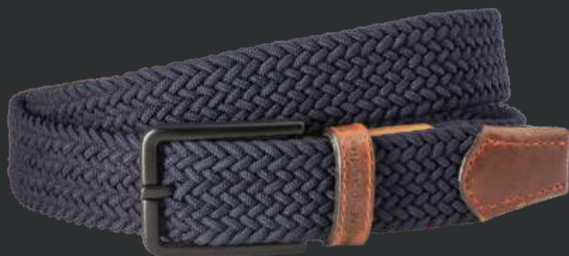
40 marine / navy