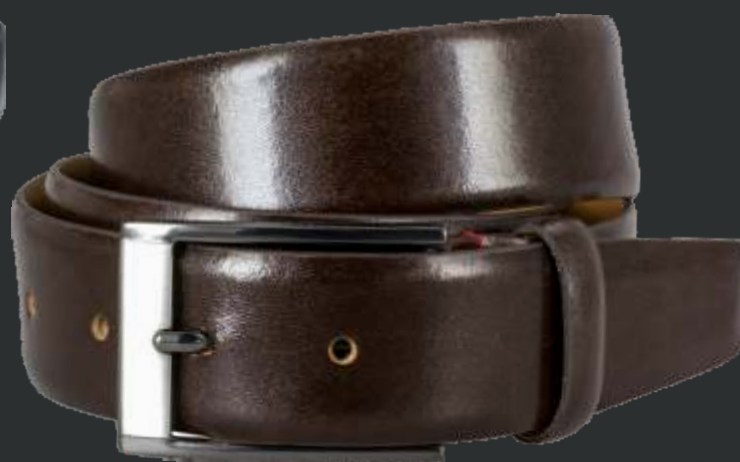
23 dunkelbraun / darkbrown