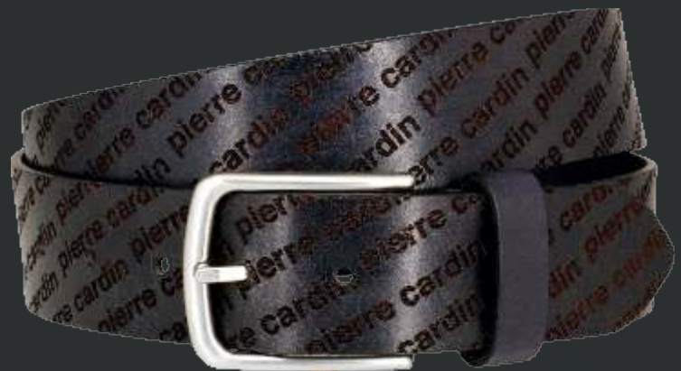
40 marine / navy